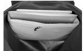
Innentasche mit Laptopfach

Infos zu IP-Symbolen: www.ortlieb.com/de/service/technisches/ip-symbole/